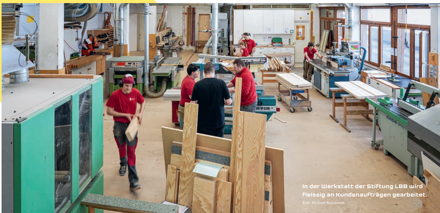
In der Werkstatt der Stiftung LBB wird fleissig an Kundenaufträgen gearbeitet.